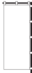
のぼり (チチは、左右どちらでも可能)